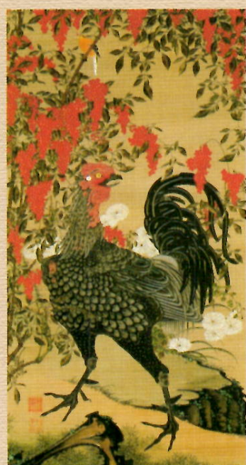
10 南天雄鶏図(なんてんゆうけいす)