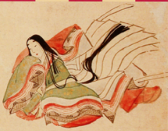
三十六歌仙図色紙貼交屏風(部分) (個人蔵)