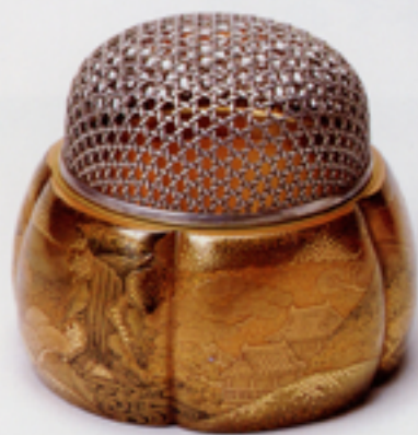
山水蒔絵阿古陀香炉 (ポーラ文化研究所蔵)