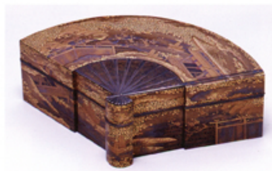
扇形初音蒔絵香箱 (ポーラ文化研究所蔵)