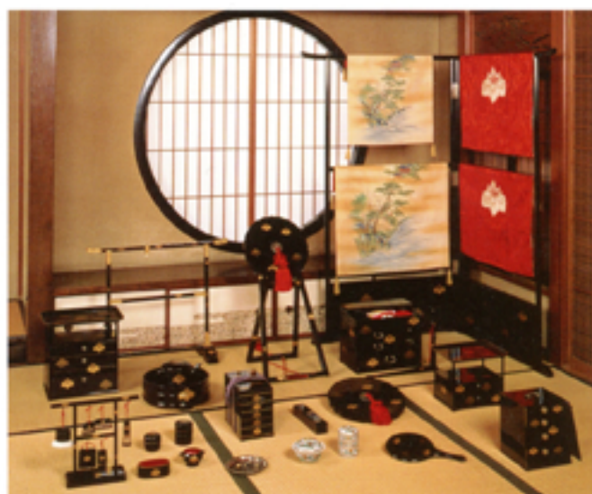
五三桐紋蒔絵婚礼化粧道具 明治時代 (ポーラ文化研究所蔵)

人はいつの時代にも衣服をまとい、化粧をほどこし身を飾ってきました。その中で様々な意匠や流行、そして新しい技術が生み出されました。この展示では江戸時代から昭和の初期までの化粧道具や衣装、髪型や装飾品などから「よそおい」の美しさとその技術をご紹介します。