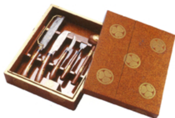
梨地葵紋蒔絵香割道具 江戸時代後期 (ポーラ文化研究所蔵)