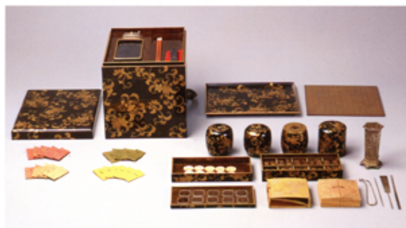
和宮所用 十種香道具 (黒塗桜花唐草蒔絵) 江戸時代末期 (東京都江戸東京博物館蔵)