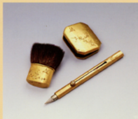
金属製梅鶯文様紅板・刷毛・柳文紅筆 (ポーラ文化研究所蔵)